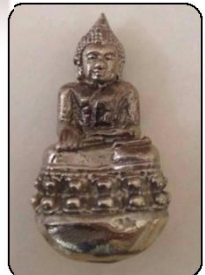
พระกันถ้วย (ครั้งแรก) องค์ละ ๒๕๐ บาท