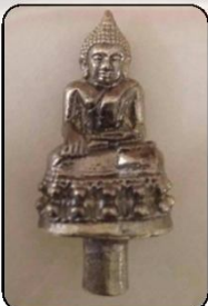
พระยอดธง องค์ละ ๒๕๐ บาท

ขอเชิญสิ่งของสุดยอดของวัดกุ่มงคดหลวงพ่อสำเร็จศักดิ์สิทธิ์ แห่งปี๒๕๕๘ รุ่น “สำเร็จแน่นอน” เสก “ยอดศีล” ชุมนุมพระวิปัสสนาจารย์ ๑๗ รูป ปัดพระอุโบสถ อัญเชิญ “เทพเทวา สถิต ณ มณฑลพิธี” ชุมนุม “พระวิปัสสนาจารย์สายพระมา” อริฐานจิต พระเกจิชื่อดังแห่งยุค นึ่งปรก