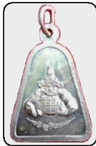
พระจอบเล็ก (ครั้งแรก) องค์ละ ๑๐๐ บาท