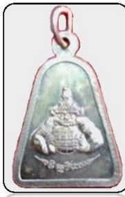
พระจอบใหญ่ (ครั้งแรก) องค์ละ ๑๕๐ บาท